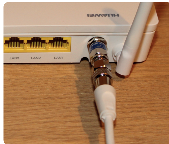
2. TV-Antennenkabel von Dose ausziehen und auf Modem-Adapter einstecken