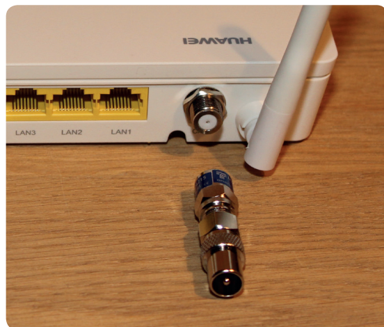
1. TV-Adapter anschrauben